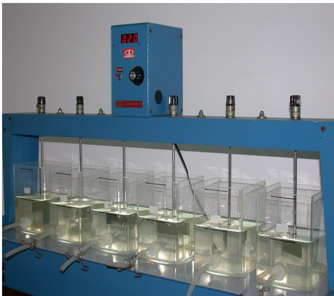
圖一:凝凝試驗攪拌機