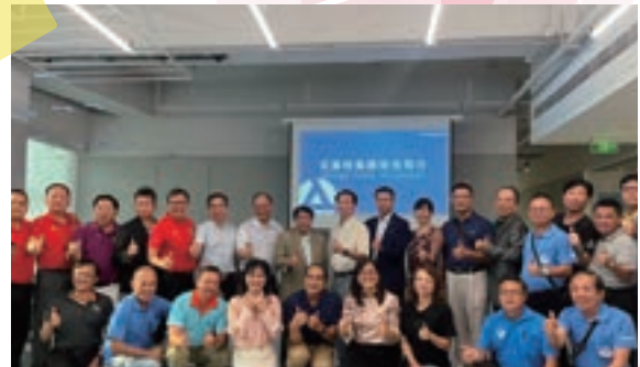
企業參訪：華南參訪首站於艾美特匯集，馬來西亞分會、旅北校友會、中區校友會及各系友分會前會長與現任會長皆共襄盛舉。