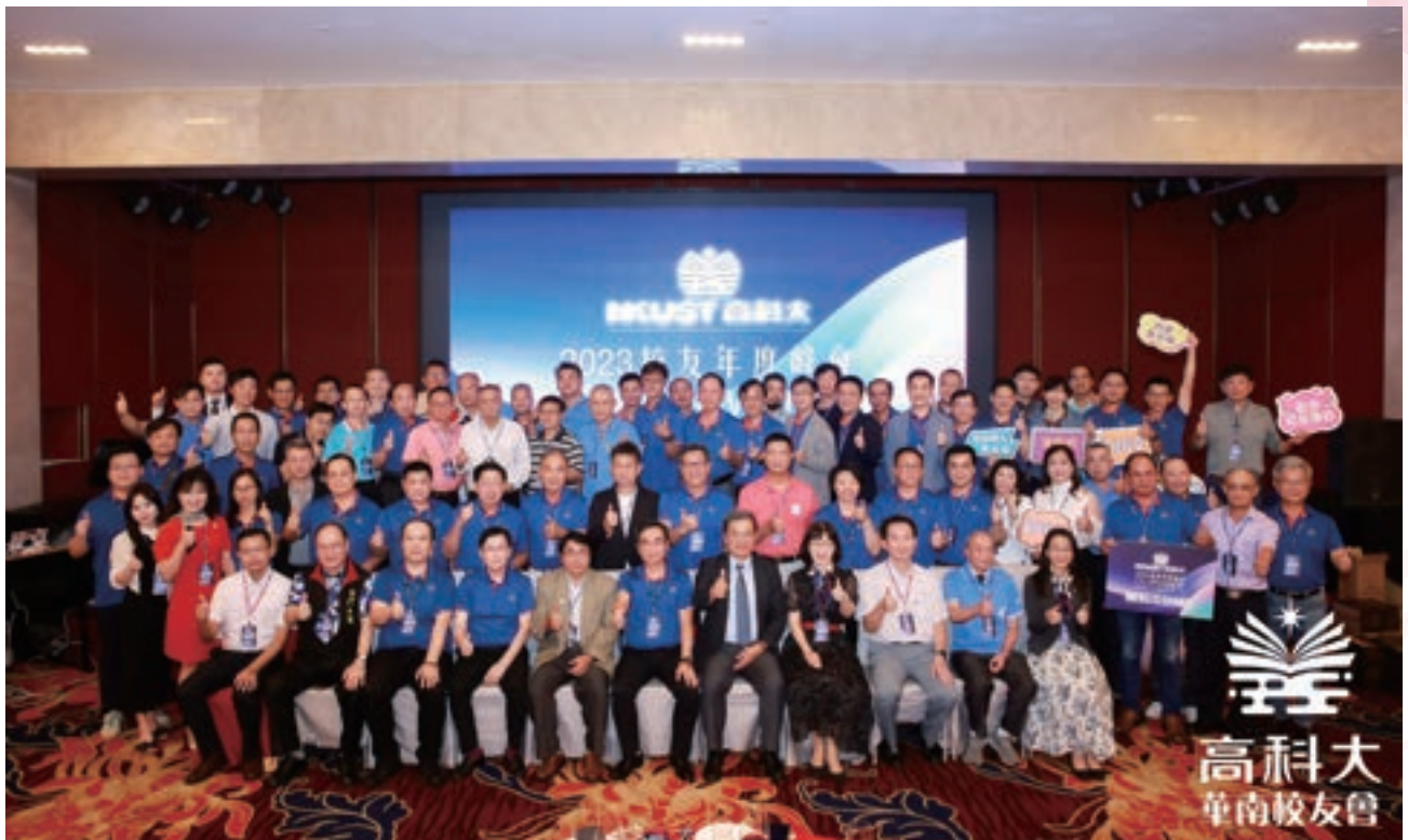
華南校友分會今年以「聚勢賦能」為主題，疫情後首次舉辦交接盛會集結各地校友赴大陸華南地區，高科大楊慶煜校長及校友總會譚本榮總會長率師長及校友共襄盛舉。