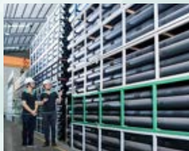
自製 HDPE 管