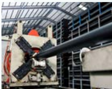
自製 HDPE 管

正當公司穩定發展之際，楊東勝開始擔憂國內市場逐漸飽和，必須開拓新市場，恰好中鋼訂閱的國際雜誌給了他靈感，「當年沒有網路，只能從報章雜誌獲得資訊。那本雜誌介紹許多礦業輸送設備展覽活動，其中最大的一場是每四年在拉斯維加斯舉辦國際