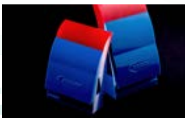
專利產品_雙色刮刀