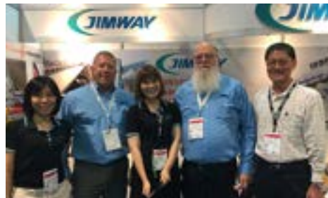
駿維 2016 年於美國參展 MINExpo_1