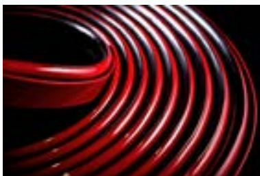
專利產品_防溢裙板