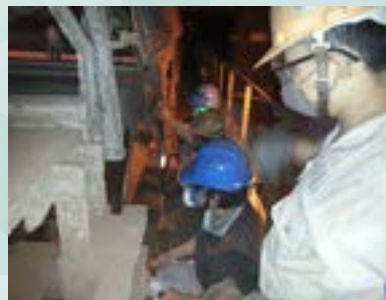
於客戶端定期巡檢